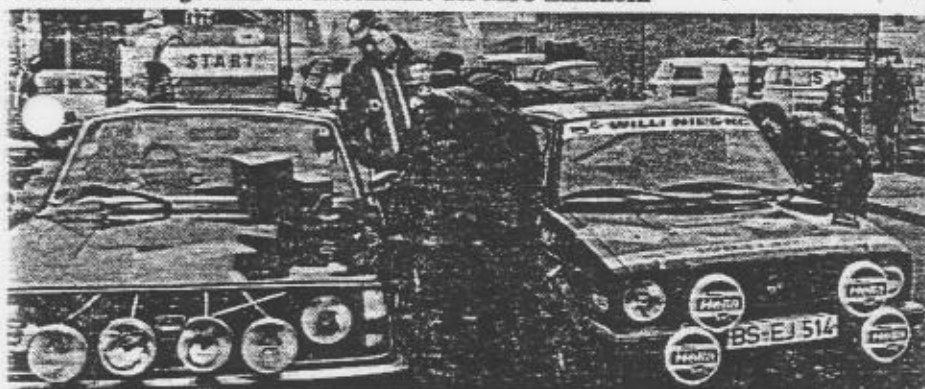
Die Rosenfahrt wurde auf dem Gelände des Köhler-Fahrzeug-Zentrums an der Rudolf-Diesel-Straße gestartet

Lübecker Team gewann die Rosenfahrt des MSC Elmshorn